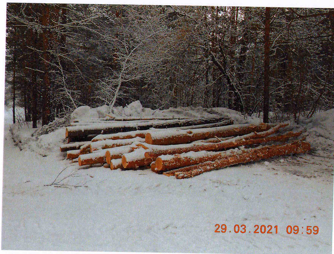
Фото 1. Фотография лесного участка

Новосибирская обл., г. Бердск городские леса, кадастровый номер: 54:32:010797:7 (местонахождение лесного участка)