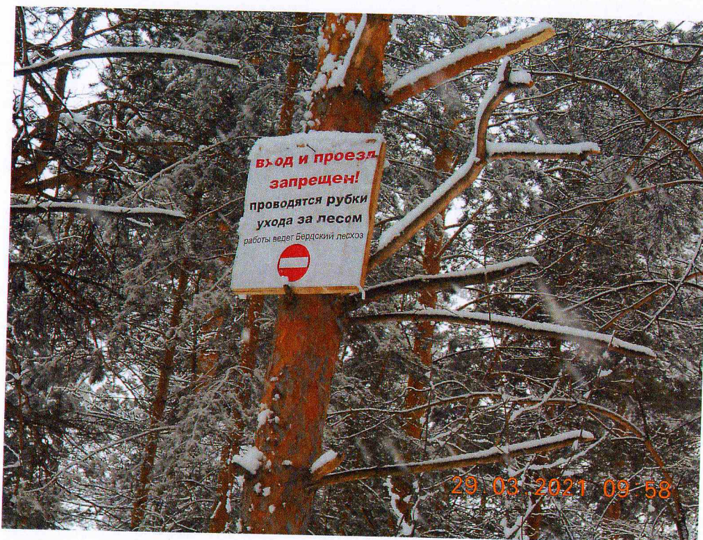
Фото 3. Фотография лесного участка