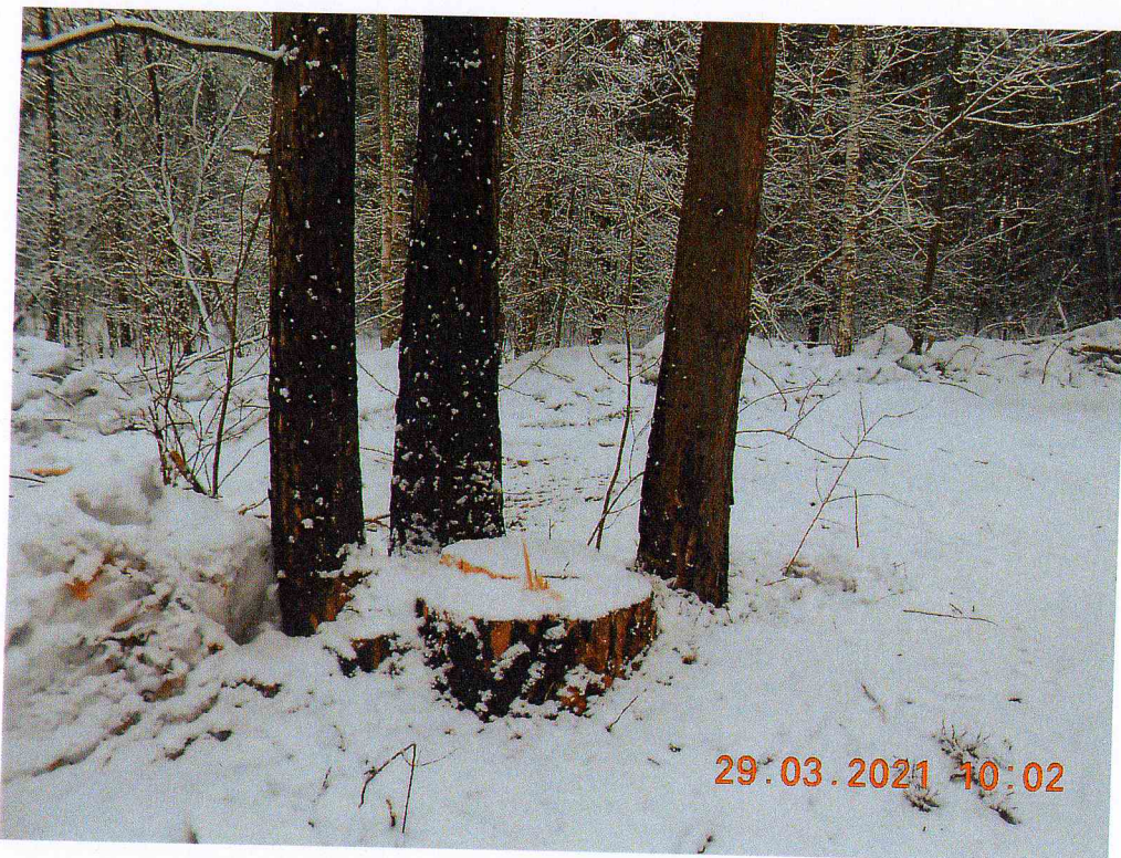
Фото 2. Фотография лесного участка