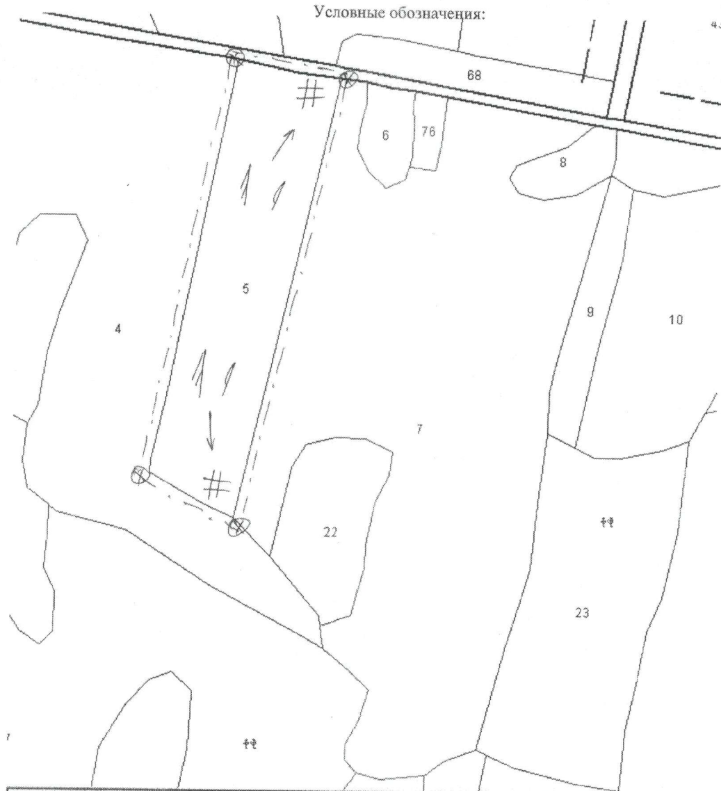
Схема (схемы) выполнения технологических операций по видам мероприятий ухода за лесами