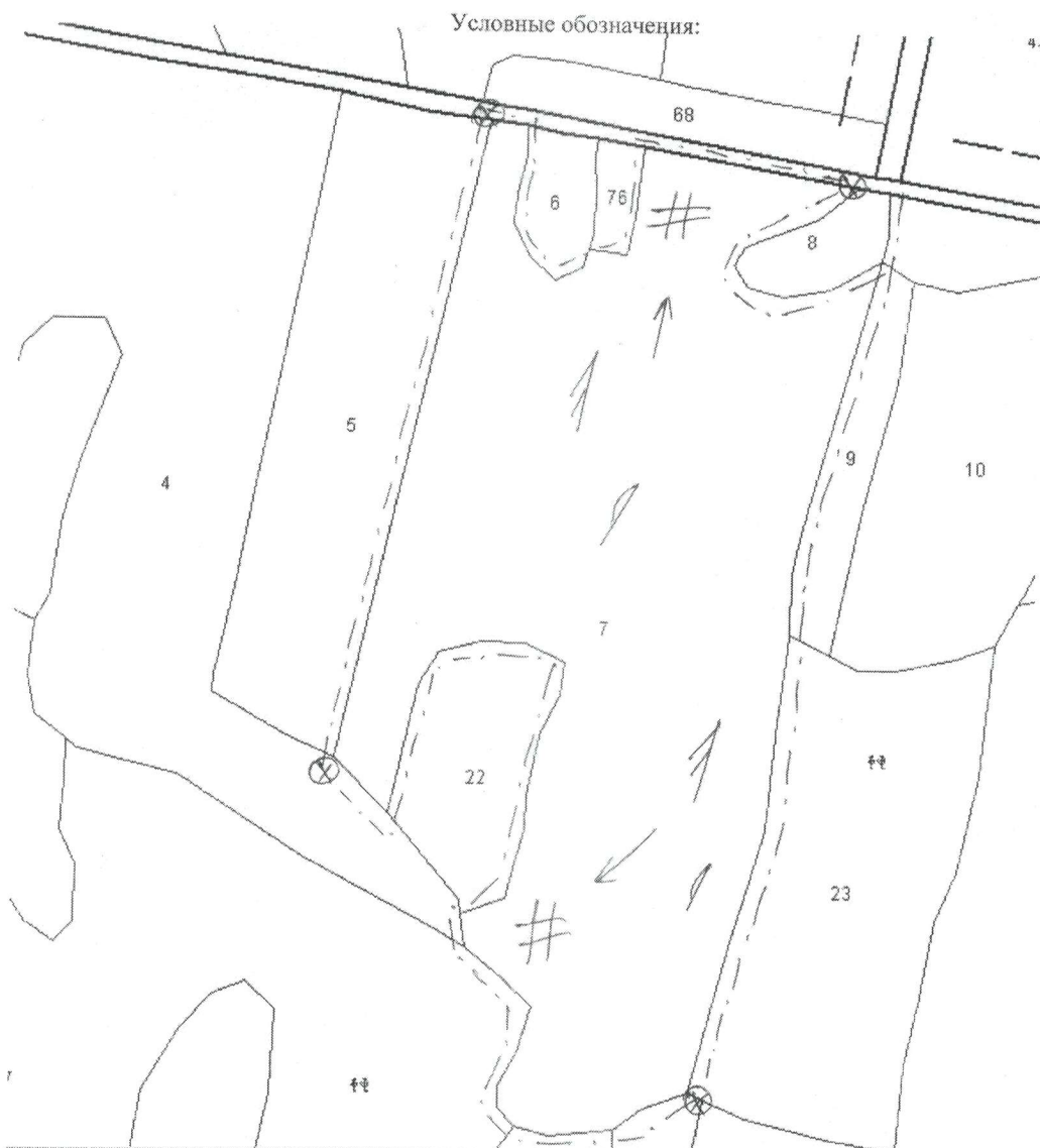
Схема (схемы) выполнения технологических операций по видам мероприятий ухода за лесами